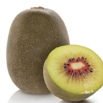
लाल (Red Passion, Don Hong)

वे चिकने होते हैं, छिलका झाग रहित होता है, और उनका मांस चमकीले पीले रंग का होता है। इनमें अम्लता नहीं होती और स्वाद मीठा होता है।