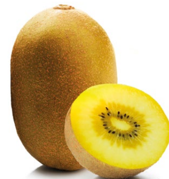
पीला (Dori, A19, Jinyan)

वे चिकने होते हैं, छिलका झाग रहित होता है, और उनका मांस चमकीले पीले रंग का होता है। इनमें अम्लता नहीं होती और स्वाद मीठा होता है।